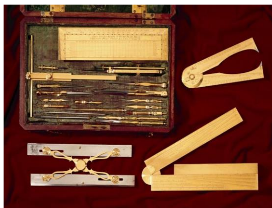
Figura 3 – Estojo estilo Thomas Sheraton e conjunto de instrumentos matemáticos. 16