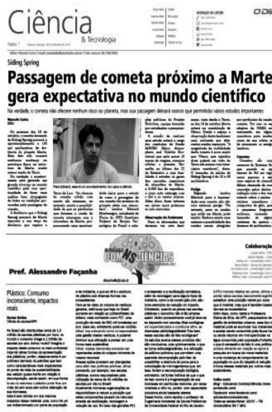
Figura 1: Layout da página da coluna no jornal impresso

O objeto desta investigação consistiu de uma coluna de publicação dominical destinada à divulgação científica que surgiu com desdobramento de um projeto institucional vinculado a uma parceria entre o corpo editorial e os coordenadores do projeto de educomunicação da Universidade Federal do Piauí.