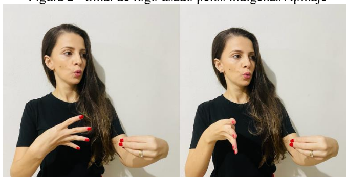
Figura 2 - Sinal de fogo usado pelos indígenas Apinajé

Para a reprodução dos sinais coletados pelos discentes, Barroso (2022) optou por usar a sua própria imagem para a construção da sua dissertação, tendo em vista que a atividade com os discentes se tratava de uma atividade de ensino, um estudo preliminar e que ainda não havia sido submetido ao Comitê de Ética em Pesquisa – CEP da universidade. A seguir, apresentamos uma amostra do resultado do mapeamento da possível língua de sinais Apinajé: