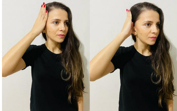
Figura 4 - Sinal de homem usado pelos indígenas Apinajé

Já na Libras, o sinal representativo de fogo refere-se às chamas do fogo e não ao objeto que produz o fogo. Pode-se dizer que, de acordo com a cultura não indígena, este sinal também apresenta traços icônicos, demonstrando-se ainda que as duas mãos têm a mesma configuração de mão e o mesmo movimento dos dedos. A seguir, selecionamos para este RE mais um exemplo das diferenças entre a possível língua de sinais Apinajé e a Libras: