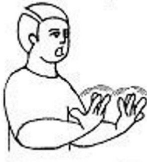
Figura 3 - Sinal de fogo em Libras